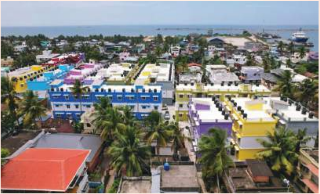
ക്യൂ.എസ്.എസ്. കോളനി, കൊല്ലം

80 വ്യക്തിഗത ഫ്ലാറ്റ് നിർമ്മാണത്തിനുള്ള ദർഘാസ് നടപടികൾ പൂർത്തീകരിച്ചു വരുന്നു.