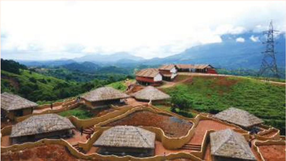
‘എൻ ഉൾ’പുക്കോട്, വയനാട്

100. അന്താരാഷ്ട്ര ടൂറിസം വിപണിയുടെ ശ്രദ്ധ ആകർഷിക്കാൻ 2022 കോവിഡ് മുക്തവർഷമായി ആഘോഷിക്കും. പുതിയ പദ്ധതികൾ ആവിഷ്കരിക്കാൻ സ്വകാര്യ സംരംഭങ്ങളെ പ്രോത്സാഹിപ്പിക്കും.