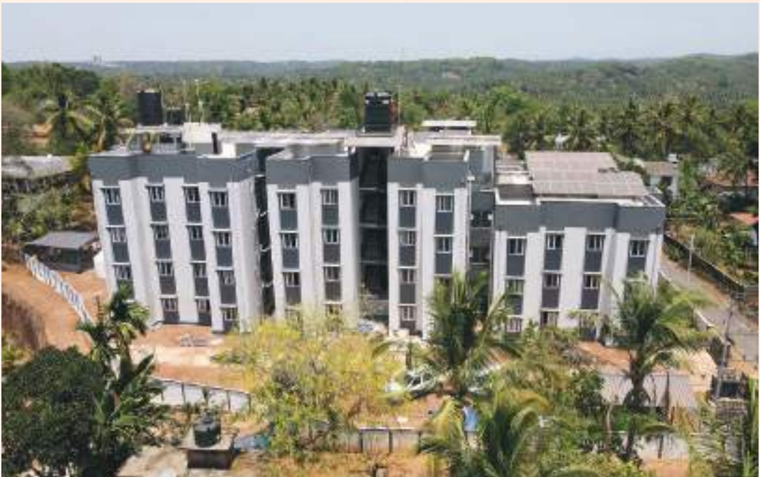
ലൈഫ് വേന സമുച്ചയം, കടമ്പൂർ

542. ലൈഫ് മിഷന്റെ അടുത്ത ഘട്ടത്തിലെ പ്രത്യേകത ഭൂരഹിതർക്കു വീട് നൽകലാണ്. അവർക്ക് ഫ്ളാറ്റുകൾ നിർമ്മിച്ചു നൽകും. അതോടൊപ്പം സ്വന്തമായി സ്ഥലം വാങ്ങി വീട് വയ്ക്കാൻ തയ്യാറുള്ളവർക്ക് 10 ലക്ഷം രൂപ വീതം നൽകും.