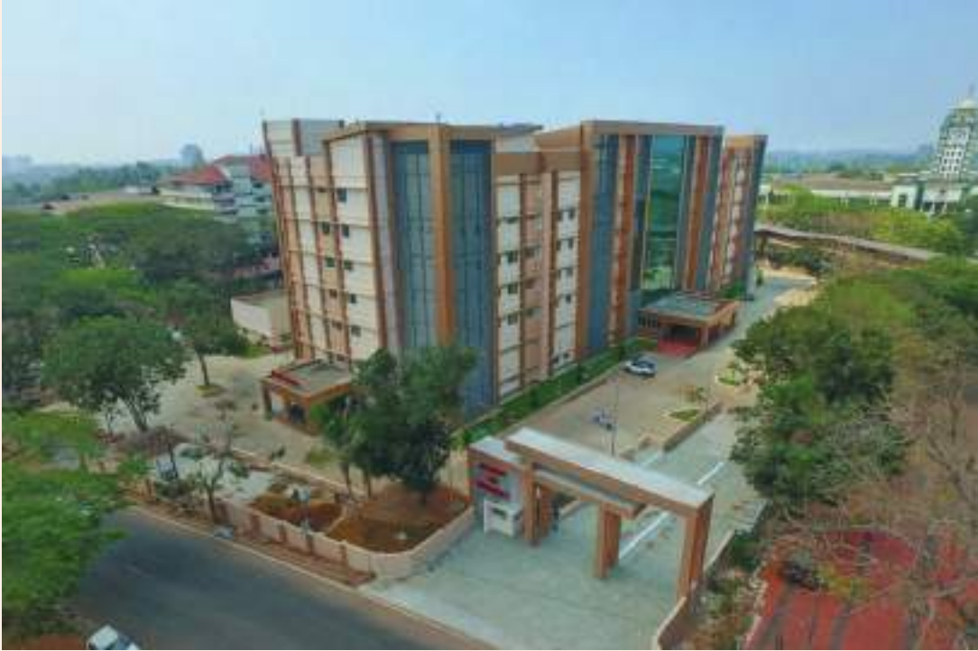
നടപ്പുസൂപ്പർ സ്പെഷ്യാലിറ്റി ബ്ലോക്ക്, കോഴിക്കോട് മെഡിക്കൽ കോളേജ്

നിർമ്മിക്കുന്നതിന് ഭരണാനുമതി നൽകിയിട്ടുണ്ട്. സാമ്പത്തികാനുമതി ലഭ്യമാക്കി നിർമ്മാണം നടത്തുന്നതിനുള്ള നടപടികൾ സ്വീകരിച്ച് വരുന്നു. കോന്നി മെഡിക്കൽ കോളേജിന്റെ രണ്ടാംഘട്ട നിർമ്മാണ പ്രവർത്തനങ്ങൾക്ക് 218 കോടി രൂപയുടെ സാമ്പത്തികാനുമതി കിഫ്ബി വഴി ലഭ്യമായതിന്റെ ഭാഗമായി മെഡിക്കൽ കോളേജിന് ആവശ്യമായ കാർട്ടേജ്സ്, ആശുപത്രി ബ്ലോക്കിന്റെ രണ്ടാം ഘട്ടം, വിദ്യാർത്ഥികളുടെ ഹോസ്റ്റലുകൾ മുതലായവ നിർമ്മാണം ആരംഭിച്ചിട്ടുണ്ട്. ഇതിൽ ഹോസ്റ്റലുകളുടെ നിർമ്മാണം അവസാന ഘട്ടത്തിലാണ്. കോന്നി മെഡിക്കൽ കോളേജിന്റെ ആദ്യഘട്ട നിർമ്മാണ പ്രവർത്തനങ്ങൾ പൂർത്തിയാക്കുന്നതിനും ഉപകരണങ്ങളും, ഓപ്പറേഷൻ തീയറ്ററുകൾ സജ്ജീകരിക്കുന്നതിനുമായി 19.5 കോടി രൂപ കിഫ്ബി വഴി അനുവദിക്കുകയും, ടി നിർമ്മാണ / വാങ്ങൽ നടപടികൾ പുരോഗമിച്ചു വരുന്നു. എറണാകുളം മെഡിക്കൽ കോളേജിന്റെ പുരോഗതിയ്ക്കായി 285.31 കോടി രൂപ കിഫ്ബി വഴി അനുവദിച്ച പുതിയ സൂപ്പർ സ്പെഷ്യാലിറ്റി ആശുപത്രി കെട്ടിടം നിർമ്മിച്ചു വരുന്നു. നിർമ്മാണം അവസാനഘട്ടത്തിലാണ്. തിരുവനന്തപുരം മെഡിക്കൽ കോളേജിന്റെ സമഗ്ര വികസനത്തിനായി കിഫ്ബി വഴി 717 കോടി രൂപയുടെ അനുമതി നൽകുകയും, ഇതിൽ 58 കോടി രൂപയുടെ ആദ്യഘട്ട നിർമ്മാണ പ്രവർത്തനങ്ങളുടെ ഭാഗമായി മെഡിക്കൽ കോളേജിലെ 6 പ്രധാന റോഡുകളും, യാത്രാക്കുരുക്ക് പരിഹരിക്കുന്നതിനായി നിർമ്മിച്ച മേൽപ്പാലത്തിന്റെയും നിർമ്മാണങ്ങൾ പൂർത്തിയാക്കിയിട്ടുണ്ട്. രണ്ടാം ഘട്ട നിർമ്മാണ പ്രവർത്തനങ്ങൾക്ക് 194.32