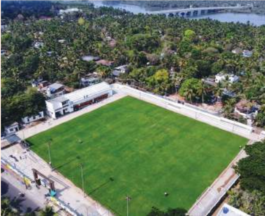
അബു-പാത്തുക്കുട്ടി മിനി സ്റ്റേഡിയം, ധർമ്മടം

ഇതിൽ ഉൾപ്പെടും. 520 കോടി രൂപയുടെ 23 പദ്ധതികൾ സ്പോർട്സ് കേരള ഫൗണ്ടേഷൻ മുഖാന്തിരം നടപ്പാക്കിവരികയാണ്. കേരള സംസ്ഥാന യുവജന ക്ഷേമ ബോർഡിന്റെ അധീനതയിൽ ദേവികുളത്ത് പ്രവർത്തിക്കുന്ന സാഹസിക അക്കാദമി വികസിപ്പിക്കുന്നതിന്റെ ഭാഗമായി പുതിയ കെട്ടിടം നിർമ്മിക്കുന്നതിന് 9,63,84,416/- രൂപയുടെ ഭരണാനുമതി നൽകിയിട്ടുണ്ട്.