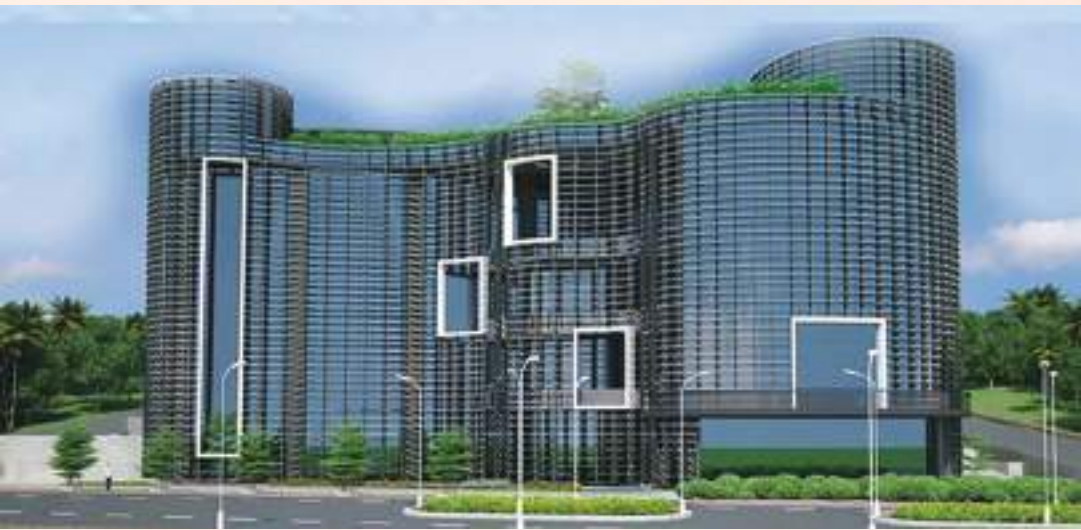
ഡിജിറ്റൽ സയൻസ് പാർക്ക് - മാതൃക

65. സർവകലാശാലകളിൽ നാനോ സാങ്കേതികവിദ്യക്ക് പ്രത്യേക വകുപ്പുകൾ ഇപ്പോഴുണ്ട്. തൊഴിലധിഷ്ഠിത നാനോ സാങ്കേതികവിദ്യാ കോഴ്സുകൾ