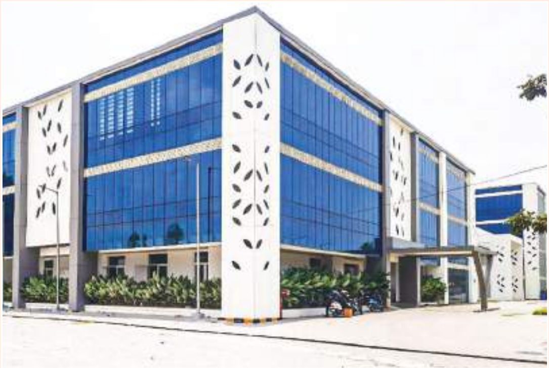
ലൈഫ് സയൻസ് പാർക്ക് തോന്നയ്ക്കൽ

59. വ്യവസായ യൂണിറ്റുകൾക്കുള്ള സ്ഥലസൗകര്യം മാത്രമല്ല, ഗവേഷണത്തിനും മറ്റും വേണ്ടിയുള്ള പൊതുസൗകര്യവും പാർക്കുകളിൽ സൃഷ്ടിക്കും.