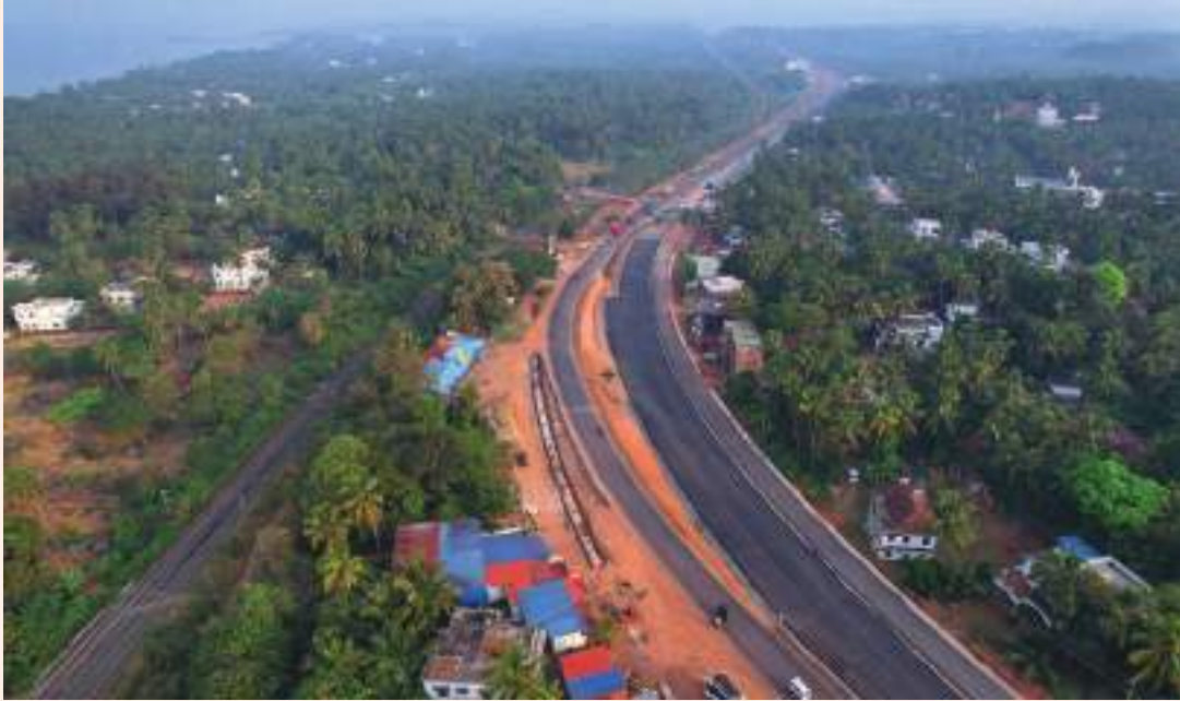
എൻ.എച്ച്.- 66 തലപ്പാടി- ചെങ്ങള

തിരുവനന്തപുരം-വിഴിഞ്ഞം-പാരിപ്പള്ളി ഔട്ടർ റിംഗ് റോഡിന് കേന്ദ്ര ഉപരിതല ഗതാഗത മന്ത്രാലയം അനുമതി നൽകി. ദേശീയപാതാ അതോറിറ്റിയാണ് നിർമ്മാണം നടത്തുക .