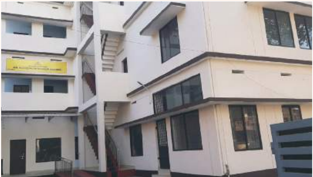
പോസ്റ്റ്മെട്രിക് ഹോസ്റ്റൽ താന കണ്ണൂർ

ഗോത്രസാരഥി പദ്ധതി പട്ടികവർഗ്ഗ വികസന വകുപ്പ് ഏറ്റെടുത്ത് വിദ്യാവാഹിനി എന്ന പേരിൽ നടപ്പിലാക്കും.